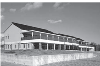
くまの・みらい保育園 (神田)

投票区が第8投票所となっている川角・石神・神田・東山地区にお住まいの方は、ご注意ください。