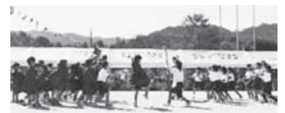
↑保健指導を取り入れた1年生の表現 「歯磨き隊長と虫歯土木組長」

好天にも恵まれ、保護者の皆さんの応援も相まって本当に盛り上がった運動会になりました。