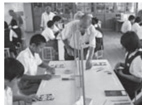
←筆づくり体験の様子

本校は、組曲「筆の都くまの」の発表を中心として、熊野町の伝統文化を継承することに取り組んでいます。これらを学ぶことを通して、伝統文化に興味・関心を持つと同時に、落ち着いて物事を考えたり、学習する意欲や態度、礼儀を身につけることをねらいにしています。このような取り組みの一環として、7月14日(火)に伝統工芸士さんをお招きし、1年生全員が筆づくりを体験しました。穂首づくりから仕上げに糸を巻いて糊を取る作業まで、ていねいに指導を受けながら完成させていきました。完成した筆は2学期からの書写の時間で使っていく予定です。