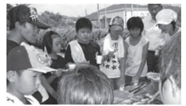
↑プレオープンでのバーベキューの様子↑