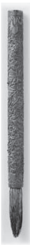
(1月中旬、筆の里工房に常設展示します。)

「木村陽山コレクション」24 唐物黄楊木彫三友小禽文筆 黄楊の軸を覆いつくすように松竹梅と小鳥が彫り込んである風流な筆です。古来より、冬の寒さにもその色を変えない松と竹、そして春に向けていち早く咲く花である梅は、「松竹梅」と呼んでめでたいものとされています。筆名にある「三友」は冬の寒い季節に友とすべき三つのもの、つまり松竹梅のこと、「小禽」は小鳥のことです。