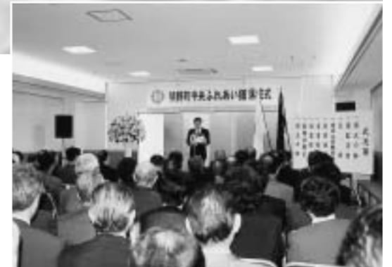
▲落成式の様子（4月17日）