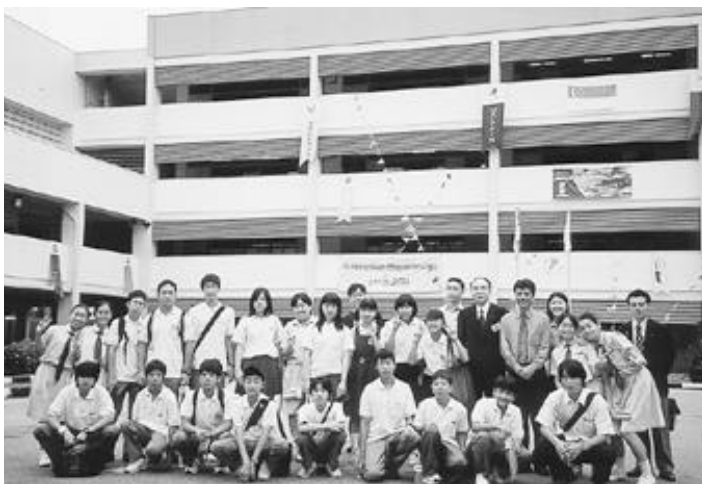
メイフラワー中学校の前で

歓迎会では、マレーシアの生徒と一緒に食事をしました。食べ物がとてもおいしかったです。特にマレーシアのカレーがおいしかったです。