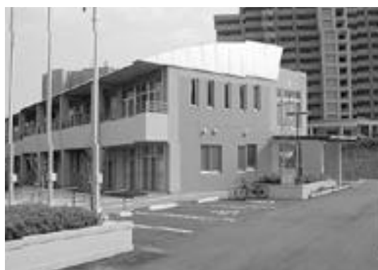
西部地域健康センター