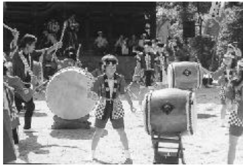
「熊野筆太鼓」によるオープニング