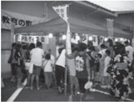
↑ 昨年の青少年テント村の様子