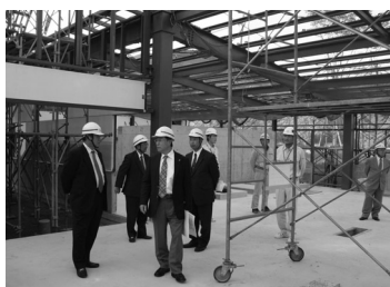
東部地域健康センターを現地視察

委員会では、建設課、都市整備課、下水道課、水道課の各建設部門から、平成18年度の主要事業実績や平成19年度の主要事業進捗状況並びに、今後の執行計画に関して具体的な報告や説明を受けた。その後、新宮深原地区に建設中の東部地域健康センターを視察し、担当者から説明を受け、建築状況についての確認を行った。