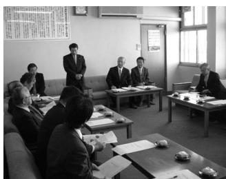
川西町視察のようす

委員会としては、この交通システムをひとつの公共交通の在り方として考え、現況の交通体系を考慮し、これからの調査・研究を行っていく。