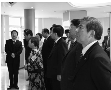
福島県議会 (工房にて伝統産業を視察)

熊野町へ視察研修で来町され、議会と執行部が対応し、事業内容等について熱心な質問を受けた。