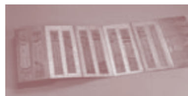
歴代天皇ほか「短冊帖 翰園」南北朝~江戸

講演会&対談 とき 10月7日(日) 講演 午後2時~3時 「古筆って何?」観賞の壺」対談 午後3時 ~3時40分 「コレクションの楽しみ」