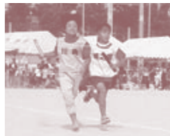
↑昨年の体育大会の様子