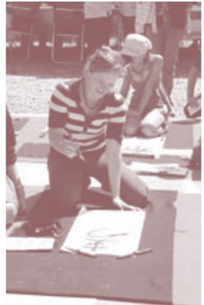
←私にも書けるかな？競書大会