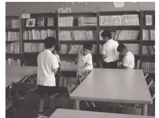
他学年と一緒に 掃除しています

朝の集団登校にはじまり、みんなで遊ぶ休憩時間、協力する掃除時間等、学校全体が大きな家族のようです。