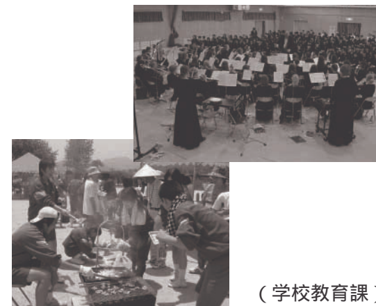
海外からの客演とバーベキュー

5月26日(土)には、晴天のもと、今年で4年目を迎えるP T C行事のバーベキュー大会を本校グラウンドで3年生を中心に、「おもてなしの精神」で開催しました。全校生徒・保護者・教職員総勢約500名の参加者は、全員大満足でした。