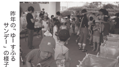
昨年の「ゆーすふる サンデー」の様子