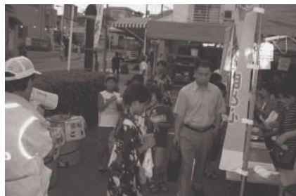
昨年の青少年 テント村の様子