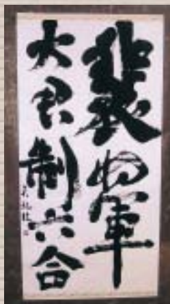
熊野高等学校 題名「裴將軍詩」

【評】この作品は、アクリル版を糸のこぎりで切り、サンダーで模様を入れ、接着剤で貼り付けて作ったモビールです。海の底、サンゴ礁の近くで美しい魚達が本当に楽しそうに泳いでいるようです