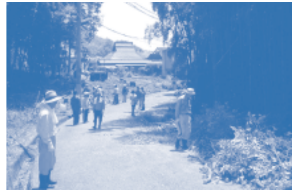
↑地域の力で子ども達を守ります！

6月18日(日)、呉地自治会の役員・消防団・老人クラブの皆さんと、東中学校のPTAなど総勢80人が、東中学校通学路の雑木等の伐採を行いました。生徒たちは、「見通しも良くなり明るくなって、安心して通学することができる」と大変喜んでいました。