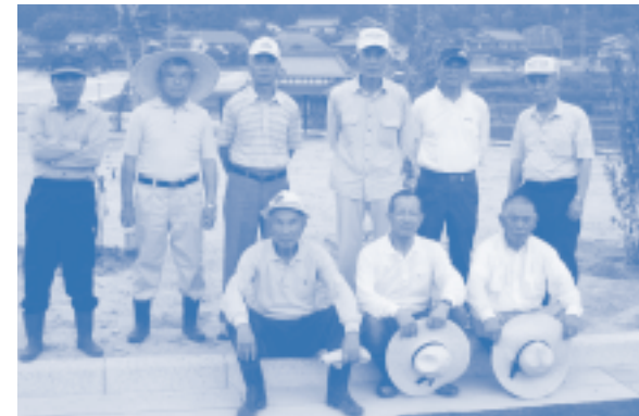
↑植樹後の新宮・初神みどりの会の皆さん