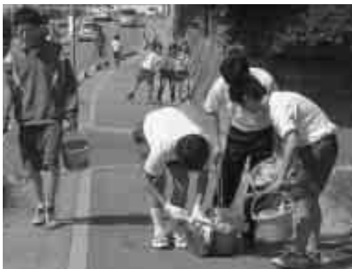
暑い中みんなががんばりました

昨年は熊野町公衆衛生推進協議会から本校の美化委員会、野球部、陸上部の清掃活動をはじめ、各学年ごとの校外清掃活動を表彰していただきありがとうございました。