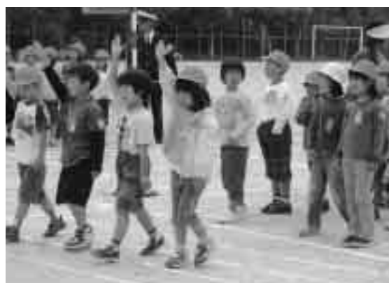
横断歩道を渡る練習をしました

横断歩道を渡る練習では、運動場での丁寧な指導と、実際の学校前の歩道での練習で、交通ルールを遵守する習慣と命を守ることを誓い合っていました。