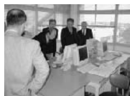
小野市では議員も積極的にパソコンを利用。

9日 兵庫県小野市「IT関連事業について」 庁舎内のIT化を推進していくことで時間短縮、人件費の縮小など、住民サービスへと繋がるので、議会としても積極的に町行政へ提言を行っていきたい。