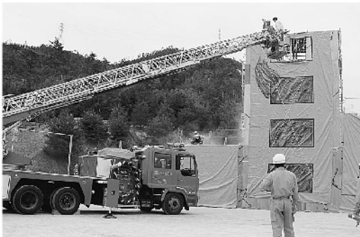
●10/31に町民グラウンドで行われた総合防災訓練の様子

Q 熊野町では、昭和20年9月17・18日の枕崎台風の時に、多くの川が氾濫して被害が大きかったと聞いている。