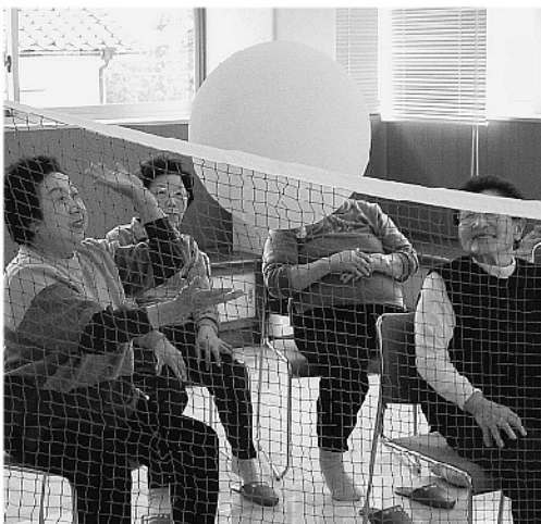
●ミニ・デイホームでの介護予防を実施していく

A 介護予防への取り組みについては「健康寿命」の延伸を図るとともに地域の活力を維持向上させるための取り組みであり、町政の重要な課題である。このため町独自の施策として生きがい活動支援事業やミニ・デイホーム事業等を実施し、ひとり暮らし高齢者等に対して心身機能の維持向上や社会的孤立感の解消を目的としたサービスを行っている。また、住民基本健康診査やガン検診等の受診率を高めていくなど、健康づくり対策についても推進していきたい。