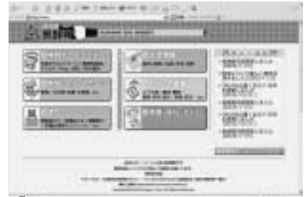
地域イントラ画面 (地域情報化管理事業)