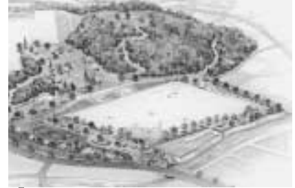
深原地区公園 完成予想図 (深原地区公園整備事業)