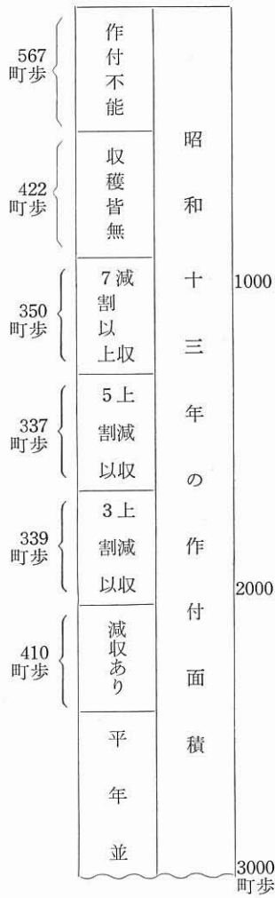
表 5-8-2 昭和14年安芸郡旱害状況

「近來稀にみる大凶作」といわれたのは、昭和十四年（一九三九）のものであった。干上がることはないといわれた坂面大池も干上がってしまい、池の底で五〇人ほどの人々が熊野独特の盆踊りを雨乞いのために舞ったという。新宮でも、雨乞いが二度も行われた。たいまつや薪を持って竜王山に登り、水神である竜王神社に祈願したの